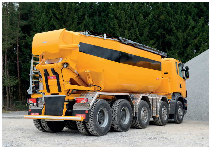
2K PUR Systeme