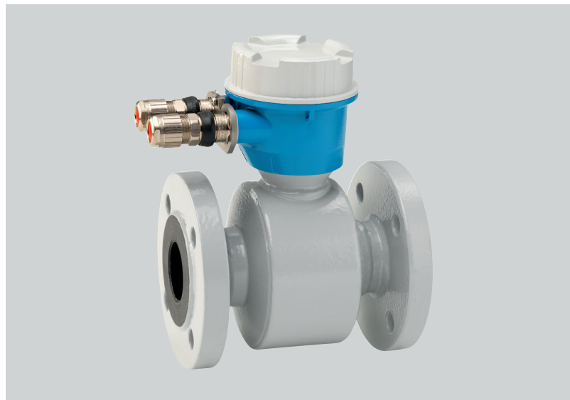
2K EP Systeme